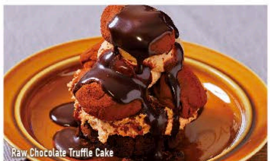
Raw Chocolate Truffle Cake