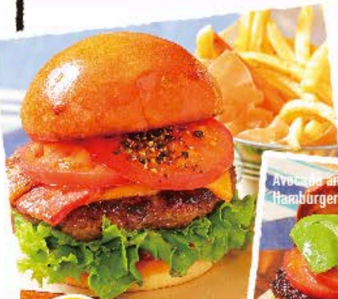
Avocado and Tomato Hamburger