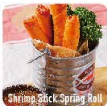
Shrimp Stick Spring Roll