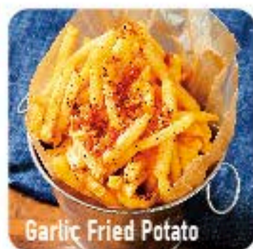
Garlic Fried Potato