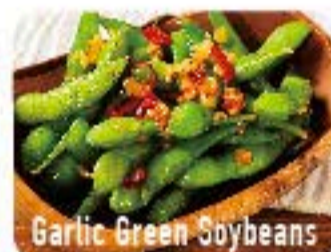
Garlic Green Soybeans