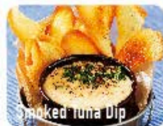
Smoked Tuna Dip