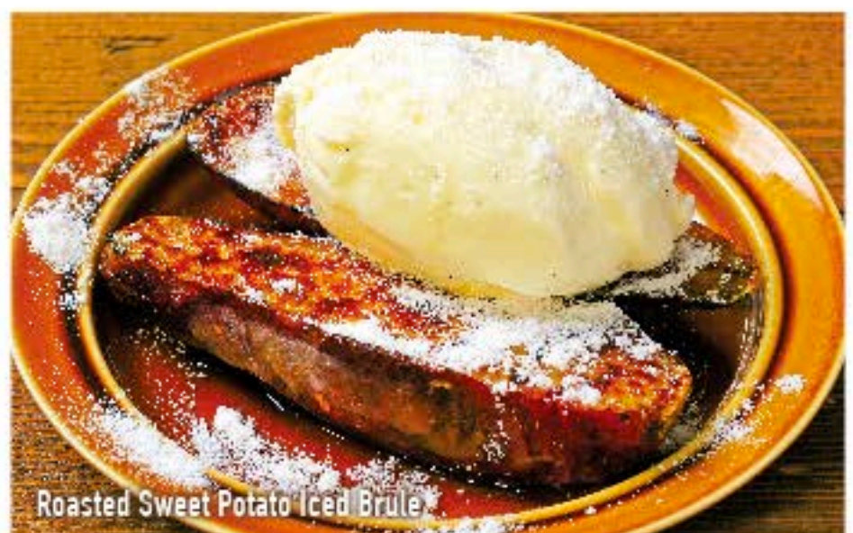
Roasted Sweet Potato Iced Brulee